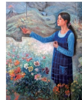
現創会賞 「とどけこの願い」 松井京子 油彩 F100