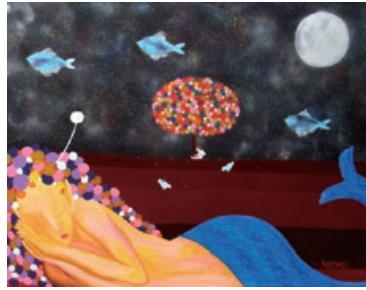
「夢の中で」 MITIKO ミックスメディア F100