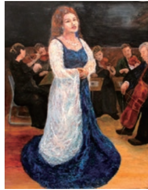
「平和を祈る歌」 三輪光明 油彩 F100