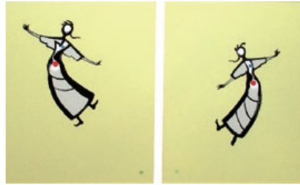
「旭日昇天:炎の舞」 太田勇 洋画 F50×2枚組